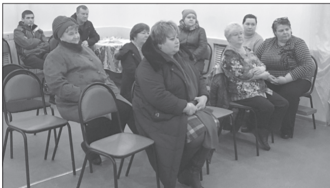
Селяне собрались на встречу с районным руководством в надежде решить самые злободневные вопросы