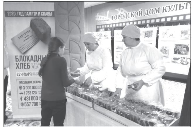
«125 блокадных грамм с огнём и кровью пополам»