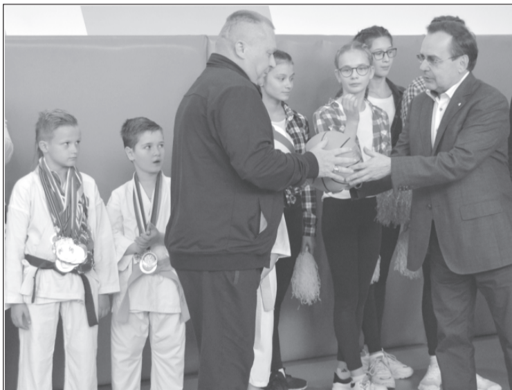
Церемония открытия спортзала в школе №12 после капремонта

Отметим, что в 2021-22 году проект по реконструкции спортзалов «Детский спорт» будет продолжен и участниками станут еще 20 школ в 9 муниципальных районах и городских округах, в том числе в г.Приволжье. На реконструкцию всех объектов будет направлено порядка 45 млн рублей.