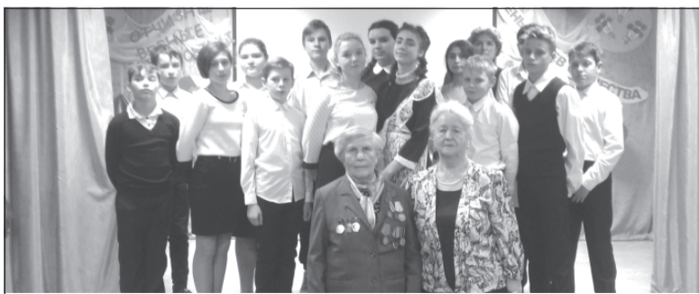
Встречи с очевидцами военных лет заставляют взглянуть на события по-новому

Семиклассники подготовили сообщения о пионерах-партизанах: Лёне Голикове, Марате Казее, Вале Котик, Зине Портновой. Просмотр видефрагмента о детях войны дал возможность сидящим в зале увидеть, в каких тяжелых условиях