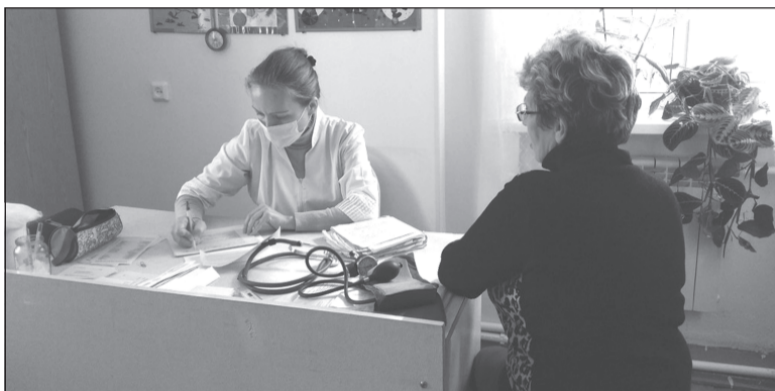
В районной больнице немало делается для того, чтобы пациентам было удобно