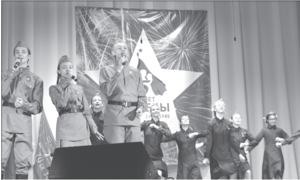
«Эх, путь дорожка, фронтовая...» исполняют «Веселинка» и «Фаина»

Сегодня на выпускном они строили планы на будущее, а завтра встали в строй и отправились на фронт – такова была завязка литературно-музыкальной композиции, ставшей составной частью большого события в нашем районе – открытия Года памяти и славы.