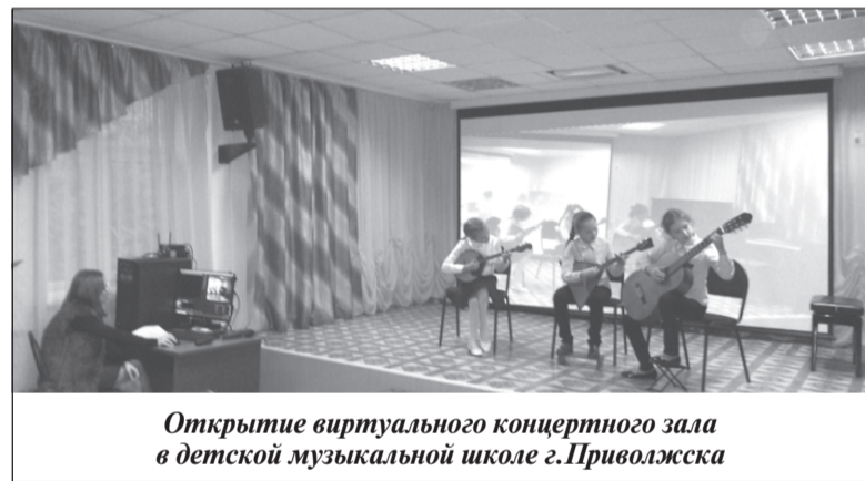
Открытие виртуального концертного зала в детской музыкальной школе г. Приволжска

В рамках нацпроекта «Культура» в 2019 году модернизировано несколько кинозалов. В частно-