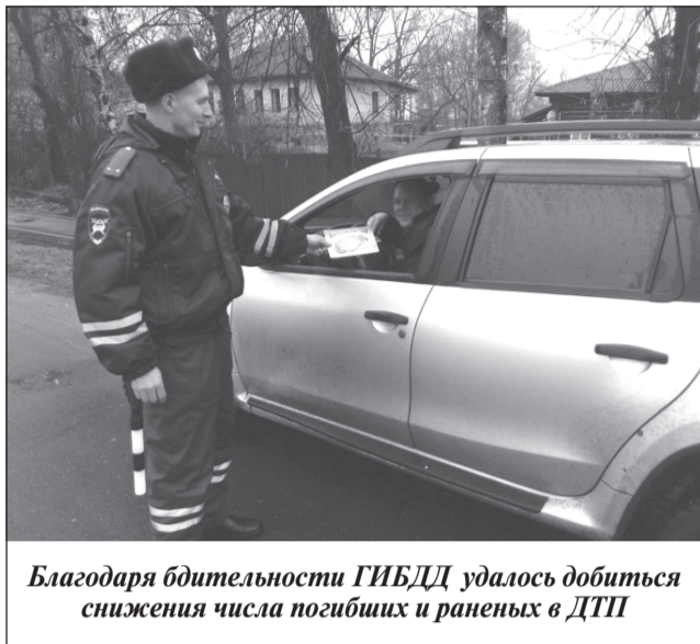
Благодаря бдительности ГИБДД удалось добиться снижения числа погибших и раненых в ДТП

Значительный объем работы выполнен по обеспечению правопорядка и общественной безопасности в общественных местах. На территории района общественный порядок обеспечивался при проведении 59 спортивных, культурно-зрелищных и религиозных мероприятий, в которых приняло участие свыше 9000 человек. Для обеспечения общественного порядка задействовано 377 сотрудников ОВД и 58 сотрудников ДНД. На территории района было про-