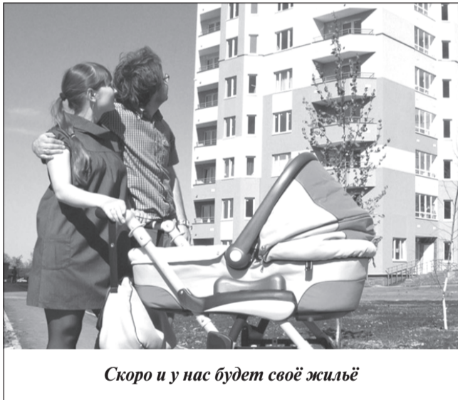
Скоро и у нас будет своё жильё

Ряд задач в сфере развития строительной отрасли в регионе обозначил губернатор Станислав Воскресенский на заседании правительства Ивановской области. На мероприятии подвели итоги работы в 2019 году и определили цели, которых необходимо добиться в 2020 году.