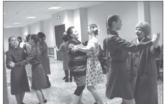
Вальс в мажоре

(к слову, это были люди разных возрастных групп)? «Уважайте свою историю!», «Берегите мир!», «Сделайте Россию счастливой!» и др.